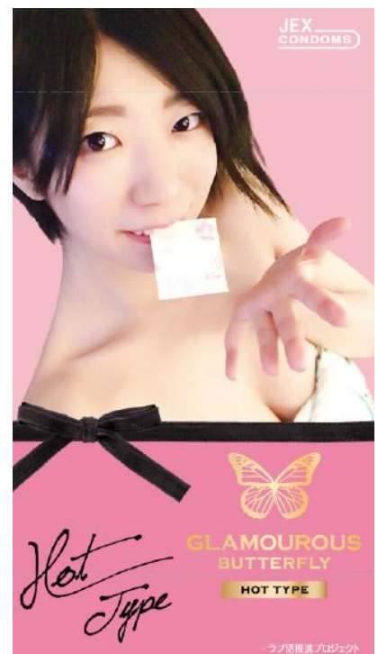
ばいばいでか美賞 『グラマラスバタフライ ばいばいでか美プレミアムパッケージ』

しかし、生殖としての性以外、コミュニケーションやプレジャーな要素も人間としての大切な性です。このような難しさを、楽しく真面目で実践的な啓発が出来ればという事で実施させて頂いており、みなさんに参加して頂いた事で、より多くの視点から性を考えて頂く機会を持てたと思います。改めて感謝させていただきます。ここを立ち寄った方も、是非じっくり楽しんで頂きたいと思っております。